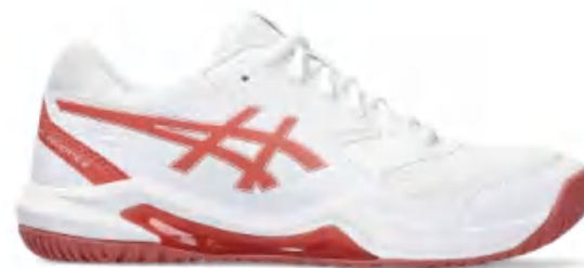
1042A237-100 上市时间: 2023AW