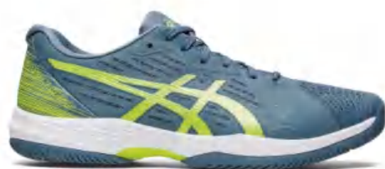
1041A298-401 尺码: 39-49 上市时间: 2023AW