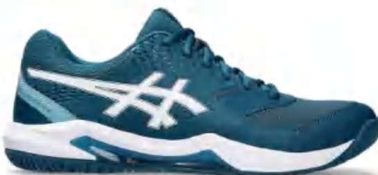
1041A408-400 1041A410-400 (2E) 尺码: 39-48.5 上市时间: 2023AW

GEL-DEDICATE 8 网球鞋提供良好的稳定性与弯曲性, 让球员在赛场上保持专注; 鞋面为合成皮革材质, 支撑性更强, 确保球员变向时脚下稳定性; TRUSSTIC 稳定片与包覆式外底加强稳定性, 同时保证灵活性, 让球员更加自信地变向跑动。