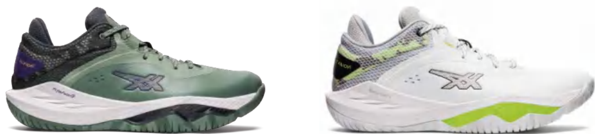
1061A043-020 尺码: 38-49 上市时间:2023SS