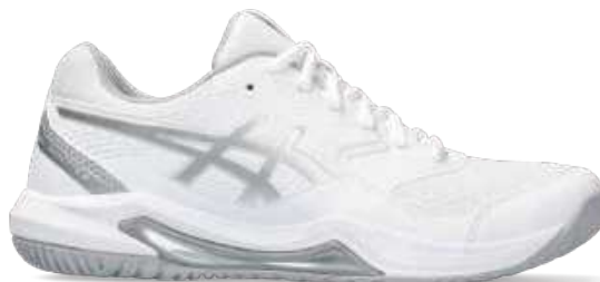
1042A237-101 尺码: 35.5-44.5 上市时间: 2023AW