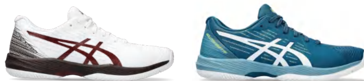
1041A298-103 尺码: 39-49 上市时间: 2023AW