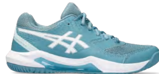
1042A237-400 尺码: 35.5-44.5 上市时间: 2023AW

GEL-DEDICATE 8 网球鞋提供良好的稳定性与弯曲性, 让球员在赛场上保持专注; 鞋面为合成皮革材质, 支撑性更强, 确保球员变向时脚下稳定性; TRUSSTIC 稳定片与包覆式外底加强稳定性, 同时保证灵活性, 让球员更加自信地变向跑动。