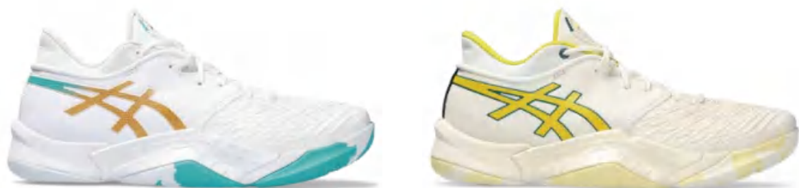
1063A056-101 尺码:38-50.5 上市时间:2023AW