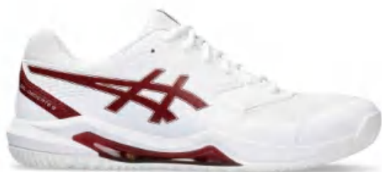
1041A408-100 尺码: 39-48.5 上市时间: 2023AW