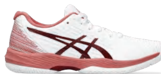
1042A197-106 尺码: 35.5-44.5 上市时间: 2023AW