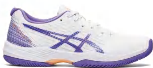
1042A197-105 尺码: 35.5-44.5 上市时间: 2023AW

SOLUTION SWIFT FF 是专为全场型球员设计的网球鞋款； 鞋头处加强处理，保护脚趾并增加球鞋耐用性； 外底灵感来源于 SOLUTION SPEED FF 2 的鞋底设计， 针对性的鞋底纹路设计保证运动员在球场上多方向灵活移动的需求； 中底采用 FLYTEFOAM 缓冲材料，具备轻量、缓震、耐用的特点； 中足的 TWISTRUSS 支撑科技帮助运动员在球场上更快速地完成转向运动。