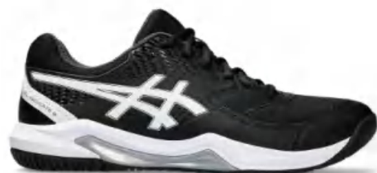
1041A408-001 尺码: 39-48.5 上市时间: 2023AW