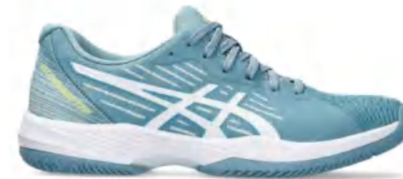
1042A197-402 尺码: 35.5-44.5 上市时间: 2023AW

SOLUTION SWIFT FF 是专为全场型球员设计的网球鞋款； 鞋头处加强处理，保护脚趾并增加球鞋耐用性； 外底灵感来源于 SOLUTION SPEED FF 2 的鞋底设计， 针对性的鞋底纹路设计保证运动员在球场上多方向灵活移动的需求； 中底采用 FLYTEFOAM 缓冲材料，具备轻量、缓震、耐用的特点； 中足的 TWISTRUSS 支撑科技帮助运动员在球场上更快速地完成转向运动。