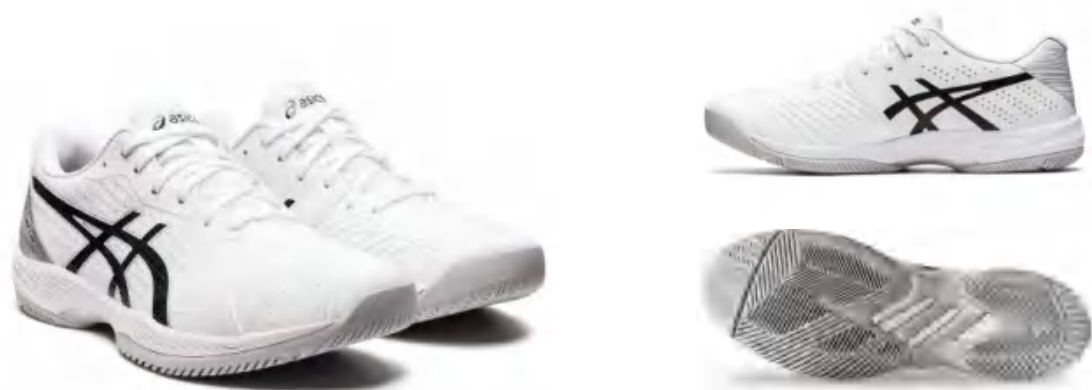
1041A298-100 上市时间: 2023AW