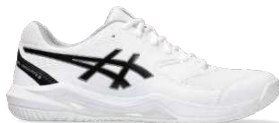
1041A408-101 尺码: 39-48.5 上市时间: 2023AW