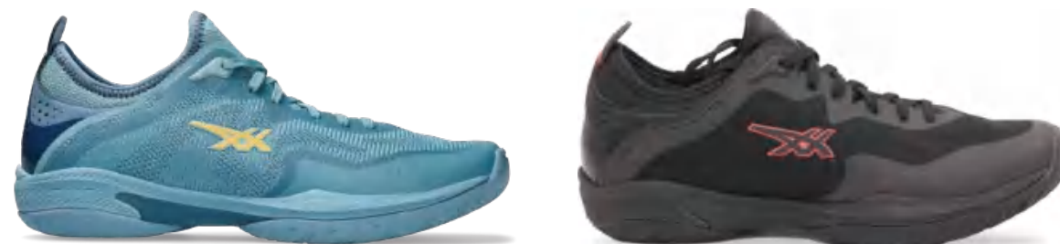
1063A072-400 尺码:37-47 上市时间:2023AW